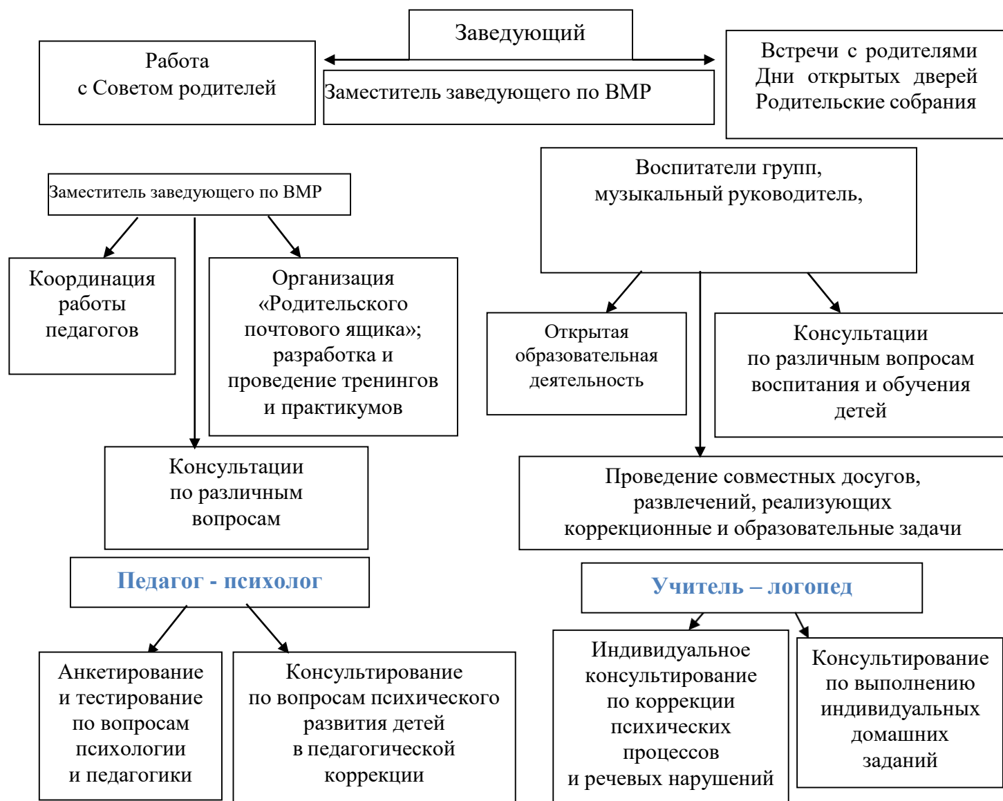
Рис. 1 «Схема взаимодействия с семьями воспитанников»